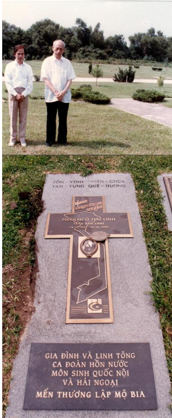
Nh Long bên c nh Linh m c Tri t gia Kim nh tr c ph n m Nh cs H i Linh.