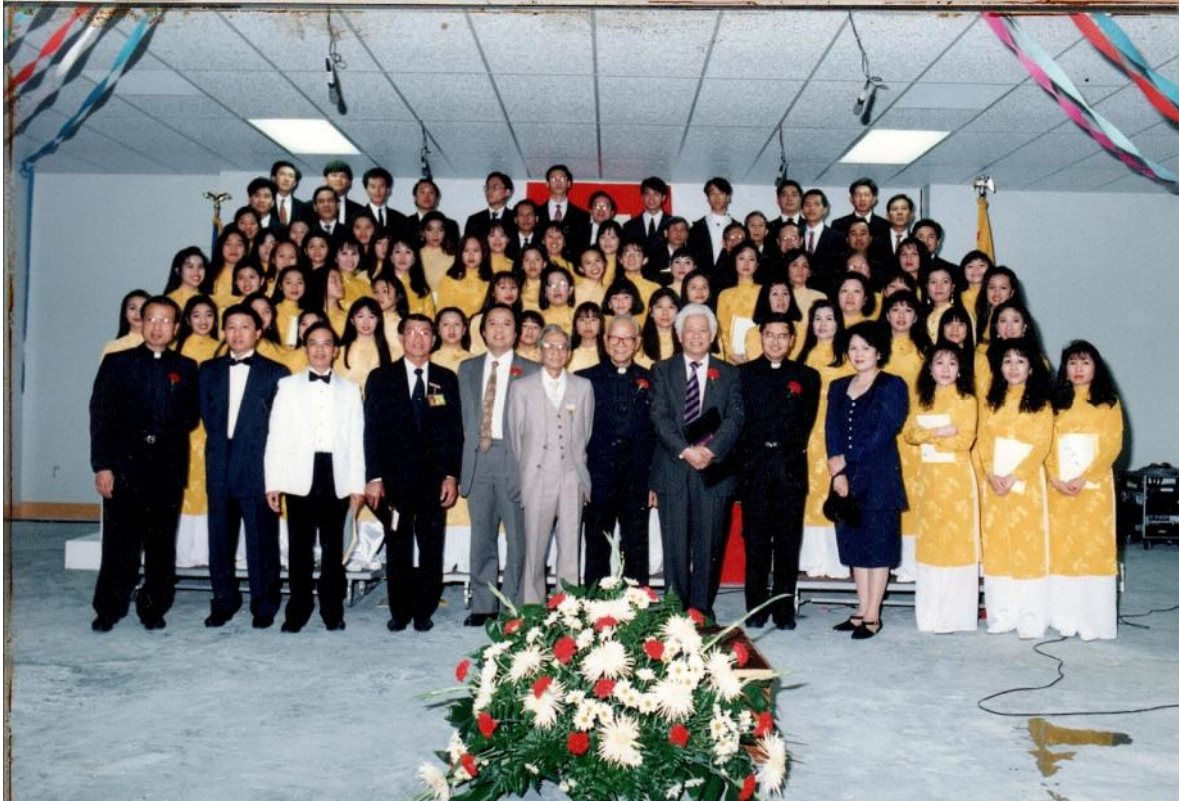
T trái: Lm Ph m V n Tu , Ct Hoàng B n, Ct Nh Long, ô. Tr n Hu nh c, Bs V Th Truy n, Gs Ph m Ngh , Cha Ngô Duy Linh, Ns Ph m Duy, Cha Tr n Cao T ng, Bà Công T ng Tôn N Bích Ng c (cháu Hàn M c T ) ch p chung v i Ca oàn Gx Thánh Lê Th Thành t ch c NGÀY HÀN M C T 19.11.1994 t i New Orleans, Louisiana, USA.