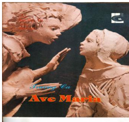
Hình bìa Giáo tr ng ca AVE MARIA - Minh ho "Thiên Th n Truy n Tin"