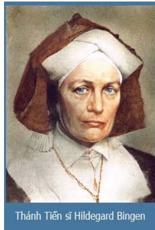
Thánh Tiến sĩ Hildegard Bingen

Giáo huấn của các Tiến sĩ Hội Thánh có thể có các dạng thức khác nhau, Đức Gioan Phaolô II giải thích rất rõ trong tông thư Novo Millennio ineunte (6/1/2001): “Cùng với việc nghiên cứu thần học, chúng ta có thể có được một sự trợ giúp đúng đắn từ di sản lớn lao là ‘nền thần học sống’ do các thánh để lại”.