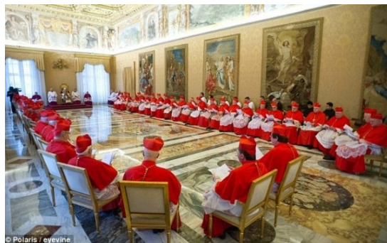
ĐTC Bênêđictô XVI công bố quyết định từ nhiệm sứ vụ giáo hoàng trong Công nghị Hồng y ngày 11-02-2013

Rôma” (emeritus). Trong Niên giám giáo hoàng, danh hiệu Bênêđictô XVI vẫn được dùng.