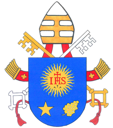
miserando atque eligendo

WHĐ (19.03.2013) – Ngày 18-03, Tòa Thánh đã công bố huy hiệu của Đức giáo hoàng Phanxicô. Huy hiệu này cũng gần giống huy hiệu giám mục của ngài. Chiếc thuẫn có nền màu xanh sáng, chính giữa phía trên là mặt trời màu vàng chiếu tỏa các tia sáng rực rỡ. Ba ký tự IHS màu đỏ bên trong mặt trời là các mẫu tự viết tắt tên Chúa Giêsu (cũng là biểu tượng của Dòng Tên). Một cây thánh giá cũng màu đỏ xuyên qua chữ H, và ba cây đinh màu đen bên dưới. Dưới nữa ở bên trái là một ngôi sao màu vàng, biểu tượng cho Mẹ Maria, Mẹ của Chúa Kitô và Giáo Hội. Bên phải ngôi sao là một nhánh hoa cam từng biểu tượng cho Thánh Giuse, bông mận của Giáo hội hoàn vũ. Đức Thánh Cha muốn dùng các biểu tượng này để diễn tả lòng yêu mến Thánh Gia.