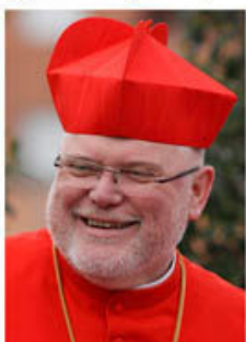
Reinhard Marx TGM München và Freising, Đức