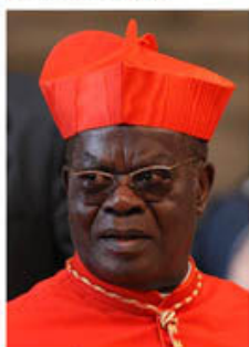
Laurent Monsengwo Pasinya TGM Kinshasa, Cộng hòa Dân chủ Congo