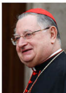
Giuseppe Bertello Chủ tịch Phủ Tổng đốc Vatican