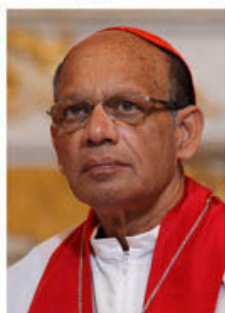
Oswald Gracias TGM Bombay, Ấn Độ