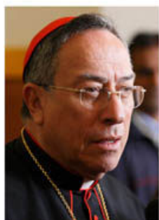
Oscar Andres Rodriguez Maradiaga, S.D.B. TGM Tegucigalpa, Honduras