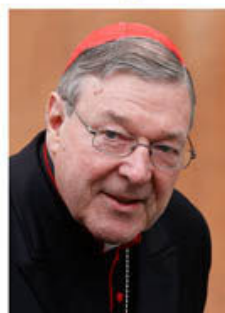
George Pell TGM Sydney, Australia

Như đã biết, Hội đồng Hồng y gồm tám hồng y, có trách nhiệm trợ giúp Đức giám mục Roma trong việc cai quản Giáo hội hoàn vũ và soạn thảo kế hoạch duyệt lại Tông hiến Pastor bonus về Giáo triều Roma.