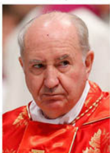
Francisco Javier Errázuriz Ossa nguyên TGM Santiago de Chile, Chile