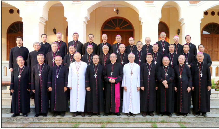
HỘI ĐỒNG GIÁM MỤC VIỆT NAM Hội nghị Thường niên kỳ I-2014 (21-25/4/2014)