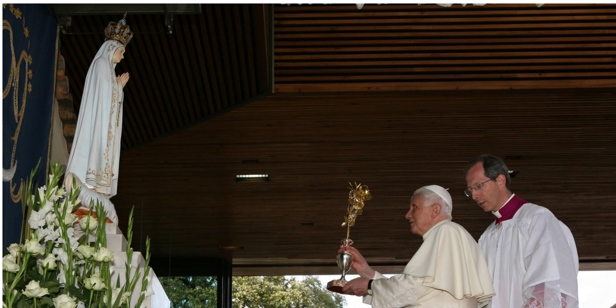
PHOTO : Đức Mẹ Fatima đã hiện ra tại địa điểm lịch sử này.. ĐTC Benedicto đến kính viếng ngày 12 Th. 5 2010